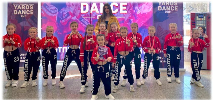
«76 регион» на Открытом кубке по современной хореографии «YAROSDANCE CUP» - 1 место