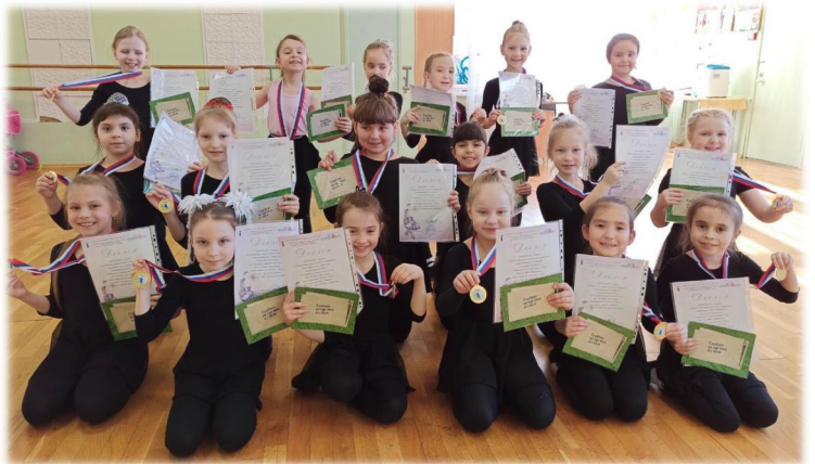
Хореографический ансамбль «Ритм»