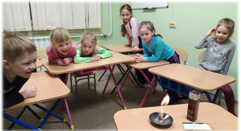
Детская образовательная студия «Золотой ключик»