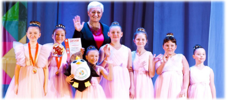
Вокальная студия «Каприз»