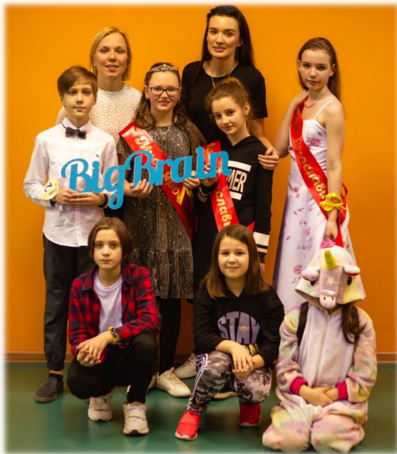
Объединение «Big Brain»