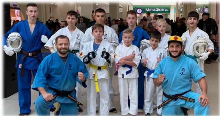
Клуб КУДО «ЯРОСЛАВИЧ»