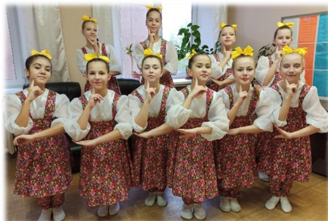
Хореографический ансамбль «Ритм»